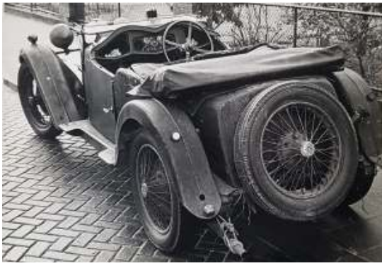
Gamecock na een lange rit van Devon naar Wassenaar