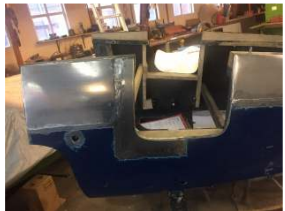
Brooklands veel meer laswerk