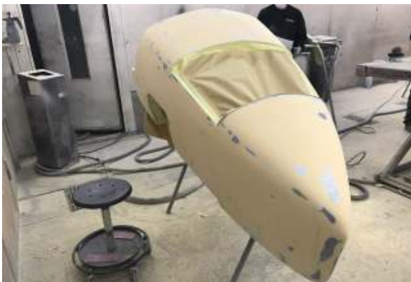
Brooklands staartstuk in de spuitplamuur