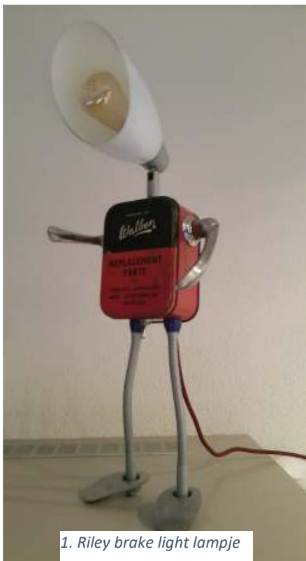
1. Riley brake light lampje

Duurzaam ondernemen en recyclen zijn begrippen waar de kranten dagelijks bol van staan. Eerlijkheidshalve moet ik er wel bij zeggen dat dat niet het eerste was waar ik aan dacht toen ik mijn overgebleven Riley onderdelen bekeek. Tijdens onze Twin restauratie die beschreven is in de Roamer 174 hadden we in al die jaren een hoop extra onderdelen verzameld die voor ons overcompleet waren geworden.