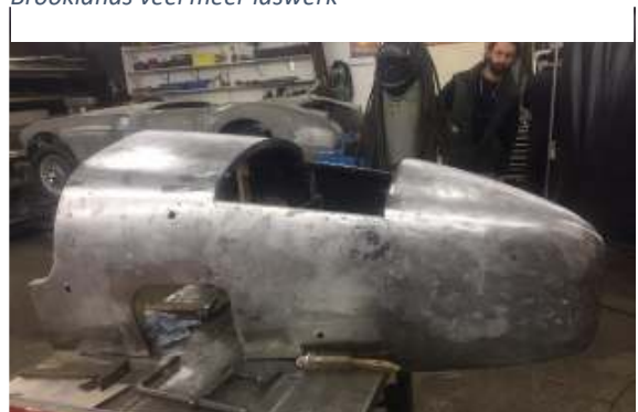
Brooklands Staartstuk voor spuiten