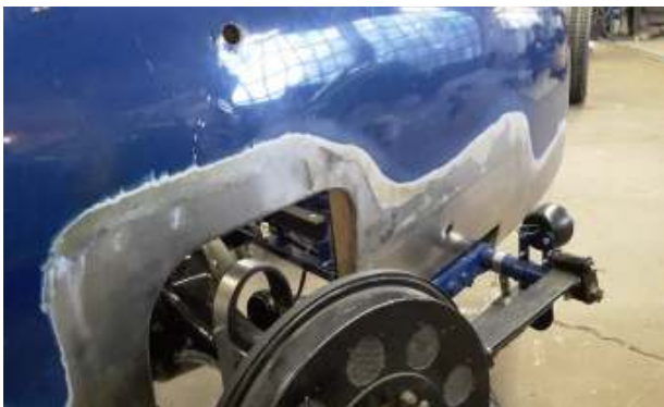
Brooklands meer inlaswerk