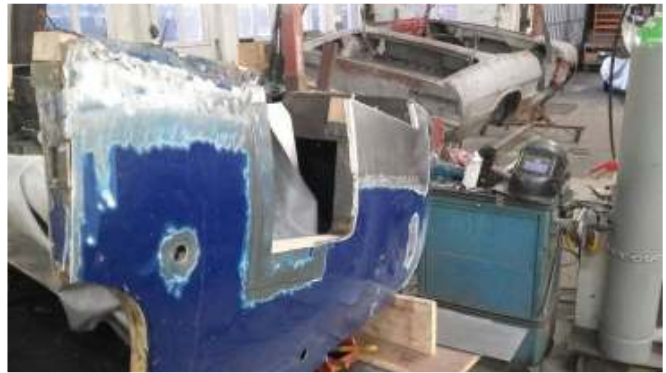
Brooklands kaal maken